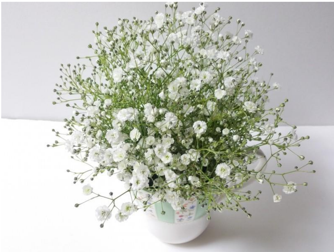
かすみ草（花言葉：清らかな心）