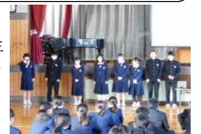
3年生を送る会の練習

3月15日(金)に卒業証書授与式を開催いたします。第3学年生徒34名がめでたく卒業を迎えることになりました。卒業生の希望あふれる姿をご覧いただくとともに前途を祝していただきたいと思います。受付は8時20分～8時30分 開式は9時となります。