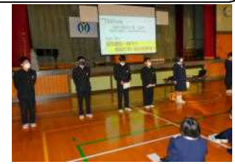
3年生を送る会の練習

3月15日(水)に卒業証書授与式を開催いたします。今年度の卒業式は、全校生徒と保護者、来賓の方すべてで卒業をお祝いいたします。コロナ禍前とほぼ同様に行いますのでご了承ください。参加につきましては、各家庭大人は2名までとします。ご理解ください。