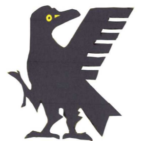
〔三本足の八咫鳥 (ヤタガラス)〕