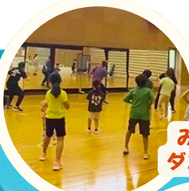
みんなの ダンス教室