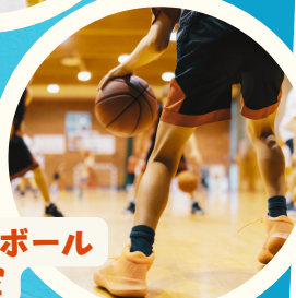
バスケットボール 教室