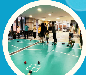
わいわいポッチャ