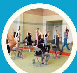
いきいき健康体操