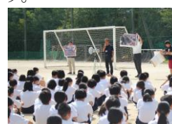
校長先生からの指導講評