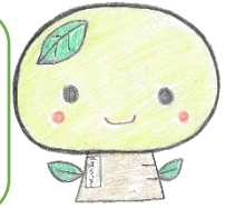
原道小マスコット「はらっきー」