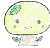
原道小マスコット「はらっきー」