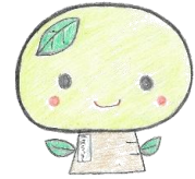
原道小マスコット「はらっきー」