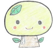
原道小マスコット「はらっきー」