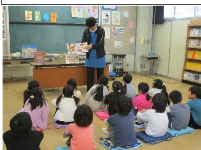
【ブックトーク】 騎西図書館の方々が来校し、学年ごとに異なるテーマでブックトークを実施しました。子供たちの読書への興味・関心が広がりました。