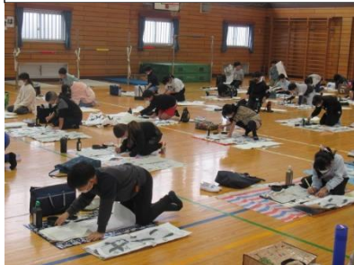
【校内書きぞめ清書会】 今までの練習の成果を発揮しようと、各学年が集中して清書に取り組みました。