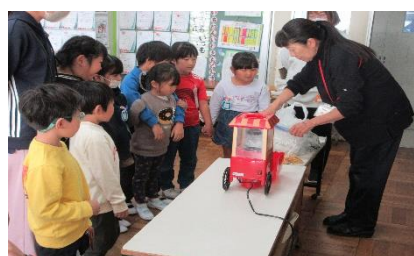
ポップコーンパーティー(1年生)