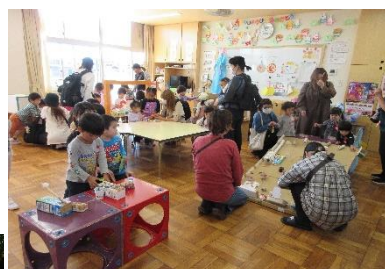
好きな遊び(更生保護女性会)