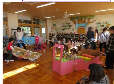
フリー参観(保護者)