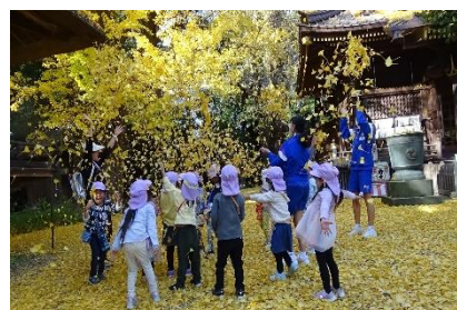
園外保育(玉敷神社)