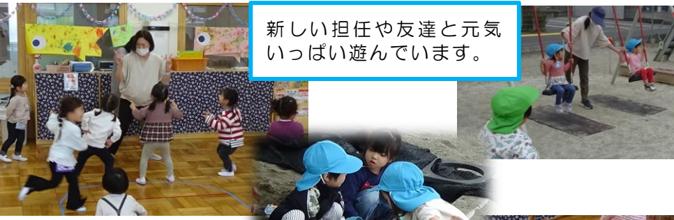
新しい担任や友達と元気いっぱい遊んでいます。