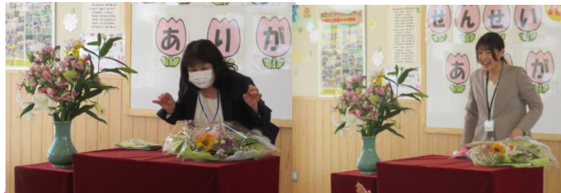
楽しみにしていた離任式。大勝園長先生は、残念ながら欠席でしたが、坂垣副園長先生、五月女先生の最後のお話はしっかりと聞くことができ、安心してそれぞれの園に戻られました。