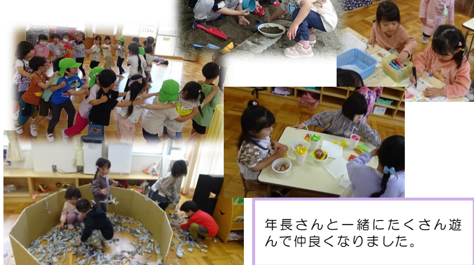
年長さんと一緒にたくさん遊んで仲良くなりました。