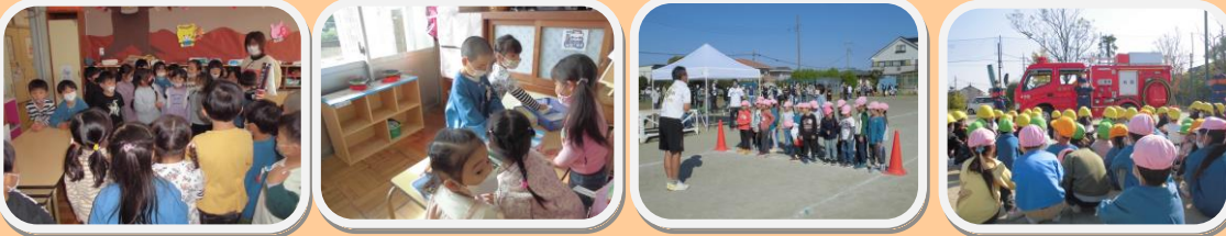
異年齢交流、一緒に遊ぶと楽しいね!

さて、保護者の皆様には、2学期も行事に御協力をいただきありがとうございました。12月は、おたのしみ会、大掃除などの行事もあります。感染症対策を講じつつ、子供たちが楽しく活動できるように援助してまいりますので、よろしくお願いいたします。