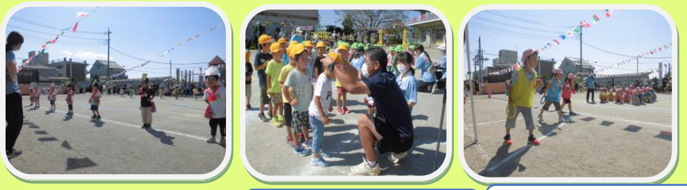
♪ハッピージャムジャム～ ドキドキしたけれど楽しく踊りました