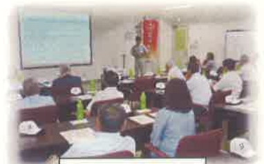
市内企業訪問研修