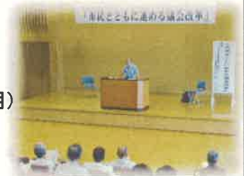
市民公開研修講座