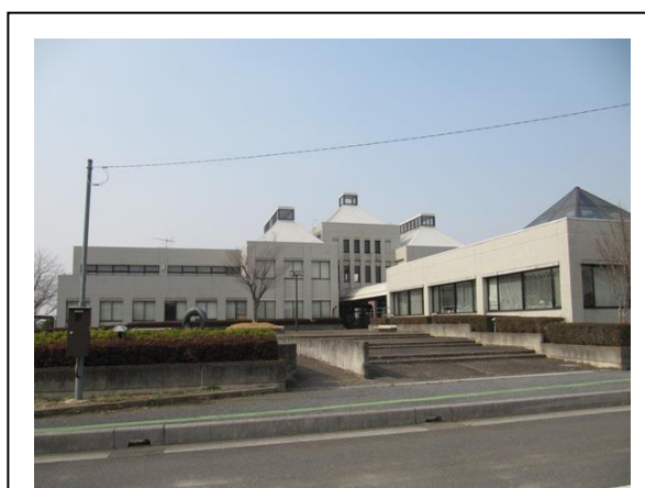
右手前：国保北川辺診療所