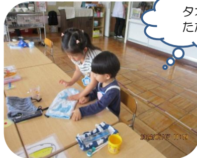
タオルを たたもう