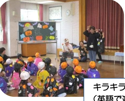
キラキラベリー (英語で遊ぼう)