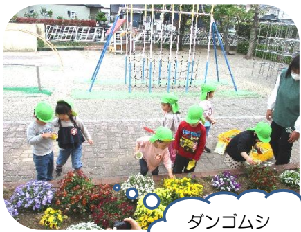
ダンゴムシ いるかな