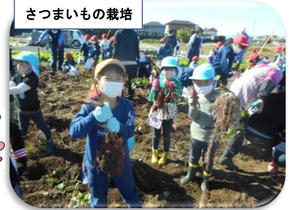
さつまいもの栽培