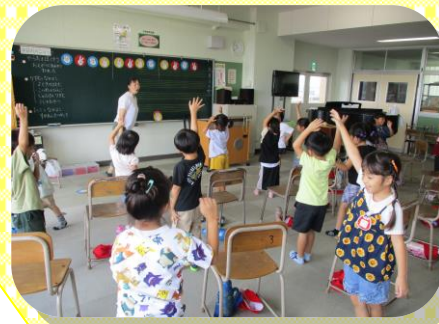
小学校の先生による授業体験 「早く学校に行きたいな。」