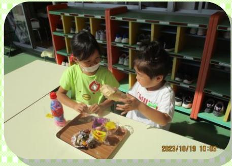
小さいクラスの友達をあそびに 招待しました。 「パン、おいしいでしょ！」