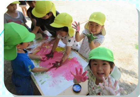
ぬたくり遊びで心も体も解放的に！ 「フィンガーペインティング楽しい！」