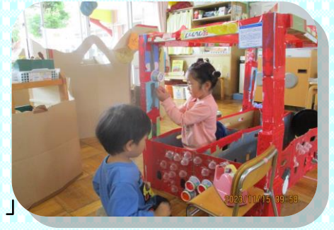
本物の消防車を見た経験から ～レスキューごっこ～ 「消防車にはボタンが たくさんあったよね！」