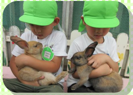
うさぎを大切に育てています 「ドッドドッって心臓の音が聞 こえるね。」