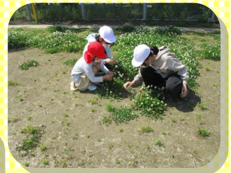
加須小5年生との交流 「小学生、やさしいな 一緒に校庭で遊んだよ！」