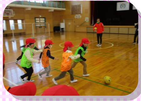
浦和レッズのハートフルサッカー！ 「負けないぞ！」