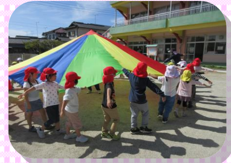
異年齢児で関わりながら 運動会ごっこ 「年長さんがパラバルーンを 教えてくれたよ！」