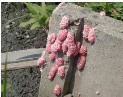
用水路（水口）の卵塊