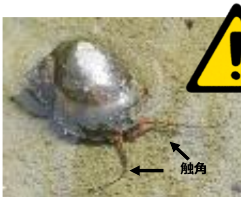
ジャンボタニシ（スクミリングガイ）