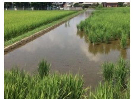
食害を受けやすい 入水口・排水口や周縁部（畦際付近）