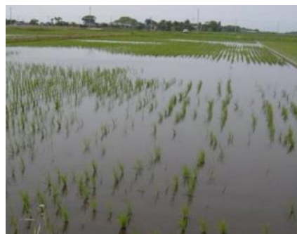
移植直後に食害を受けた移植苗