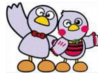
埼玉県マスコット