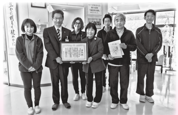
みずほの里の皆様