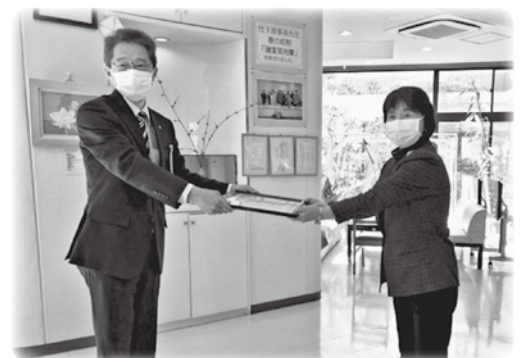
令和4年1月27日(木) みずほの里で表彰式を行いました。