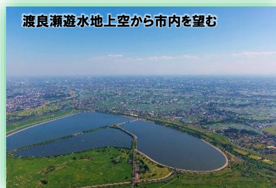
渡良瀬遊水地上空から市内を望む