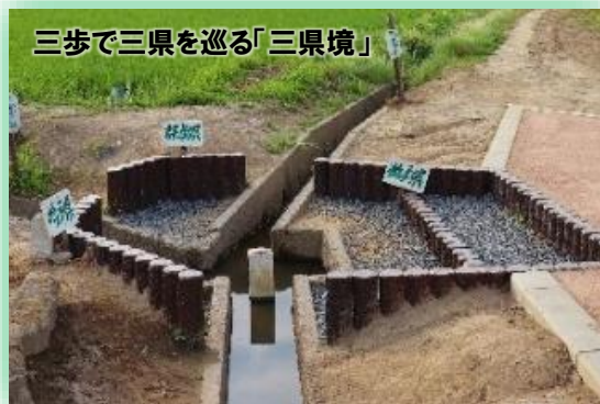
三步で三県を巡る「三県境」