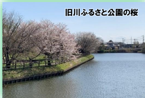
旧川ふるさと公園の桜