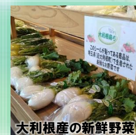
大利根産の新鮮野菜