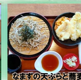
なまずの天ぷらと蕎麦