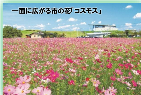
一面に広がる市の花「コスモス」