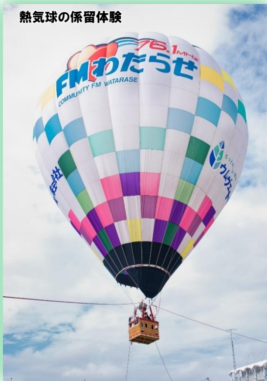
熱気球の係留体験