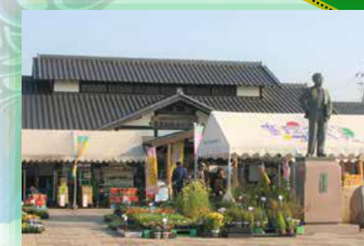
道の駅童謡のふる里おとね