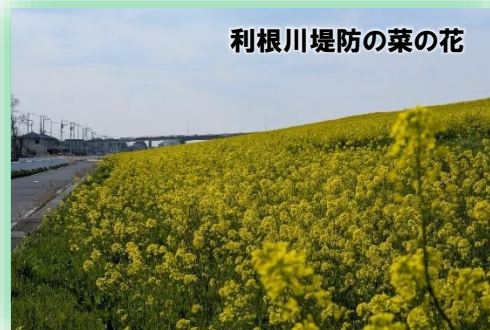
利根川堤防の菜の花