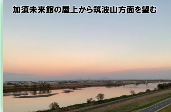
加須未来館の屋上から筑波山方面を望む