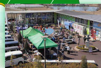
道の駅かぞわたらせ