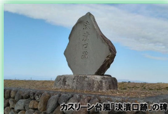
カスリーン台風「決潰口跡」の碑