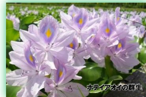
ホテイアオイの群生