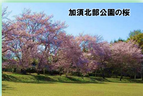
加須北部公園の桜