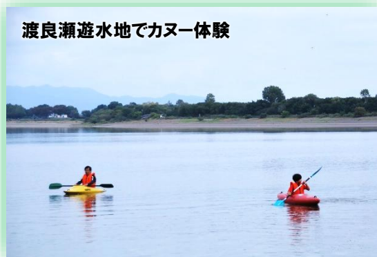
渡良瀬遊水地でカヌー体験