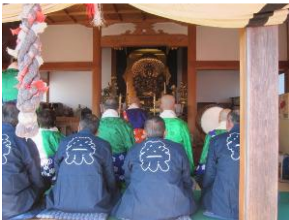
千手観音坐像の御開帳