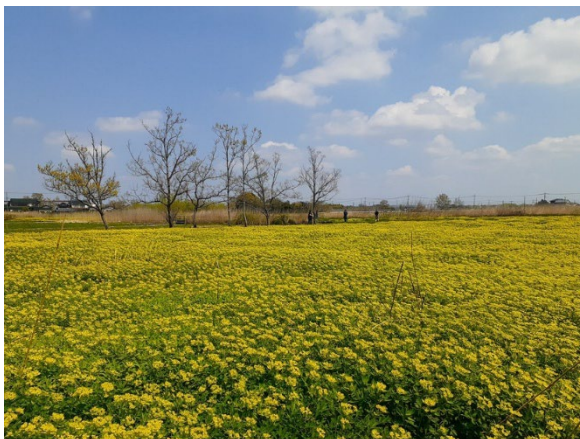
昨年の様子（令和7年4月12日撮影）