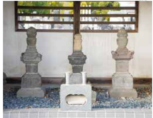
足利持氏公・春王丸・安王丸の供養塔