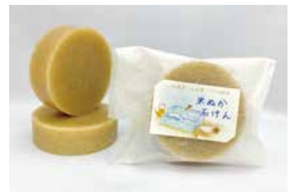
加須産「山田錦」100%使用 米ぬか石けん (雑貨)