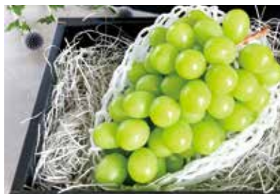
シャインマスカット18 エイティーン