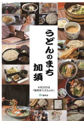
うどんのまち加須ポスター