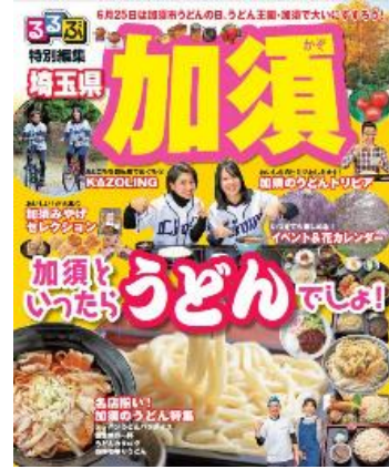
るるぶ特別編集加須

○給食での地粉うどんの提供【学校給食課・こども保育課】 提供先：市内公立小中学校・幼稚園、公立保育所