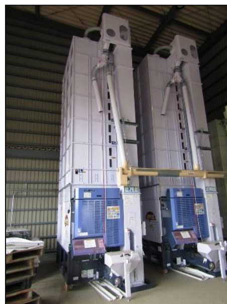
農業用機械のイメージ（乾燥機）