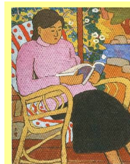
代表作「読書する少女」