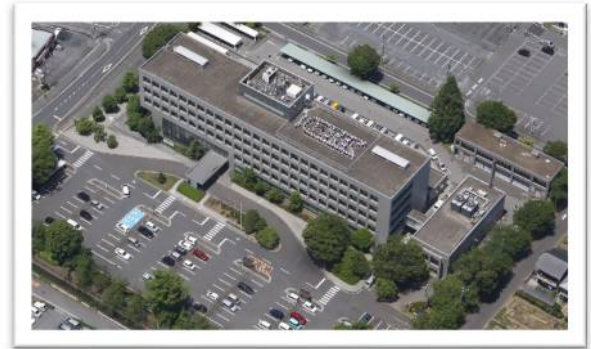
▲ 市役所屋上で人文字の 10 周年ロゴ