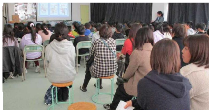
【ネットトラブル防止教室】