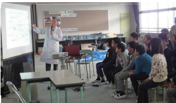
【薬物乱用防止教室】