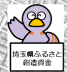
埼玉県ふるさと創造資金 埼玉県のマスコット「コバトン」

沿道利用の皆様の休息、健康維持のために、埼玉県ふるさと創造資金を活用してポケットパークを整備しています。(画像は完成イメージ)