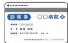
⑤かかりつけ医の診察券