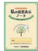
⑥私の意思表示ノート