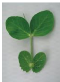
わずかにカップ状 =0.5