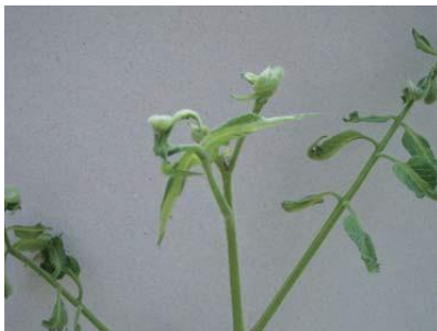
品目：トマト 症状：葉の異常