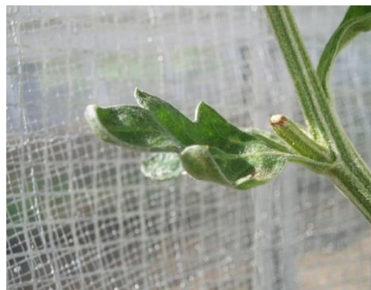
品目：きく 症状：葉の異常