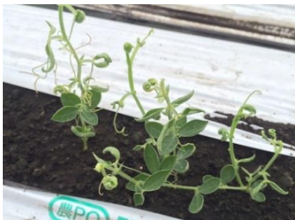
品目：スイートピー 症状：葉の異常