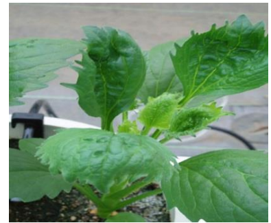
品目：アスター 症状：葉の異常