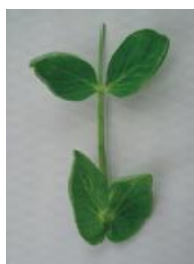
明らかにカップ状 =1