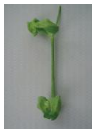
ひどく変形し原型をとどめない =3