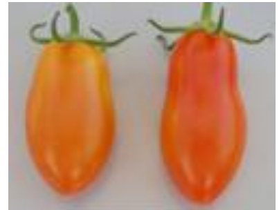
品目：ミニトマト 症状：果実が細長く変形