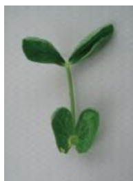
カップ状からさらに変形 =2