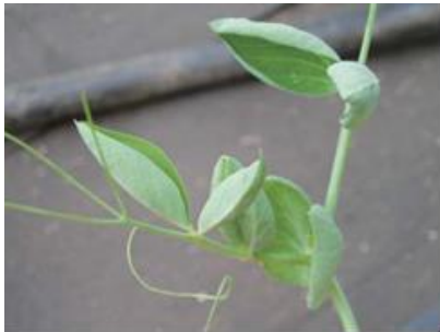
品目：さやえんどう 症状：葉がカップ状になる