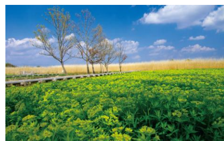
浮野の里の「ノウルシ」