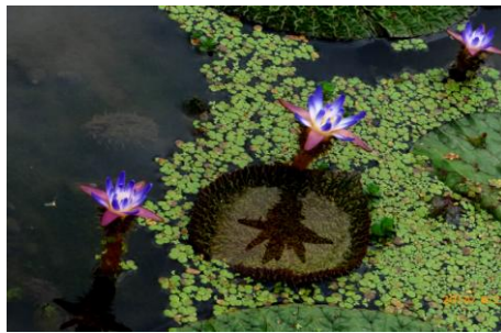
絶滅危惧種「オニバス」