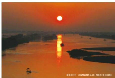
「利根川」からの朝日