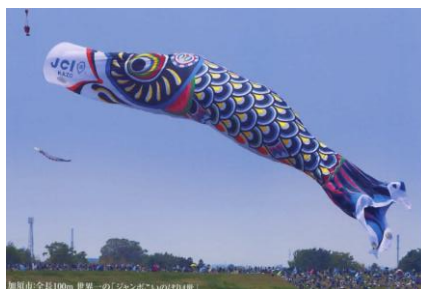
世界一の「ジャンボこいのぼり」