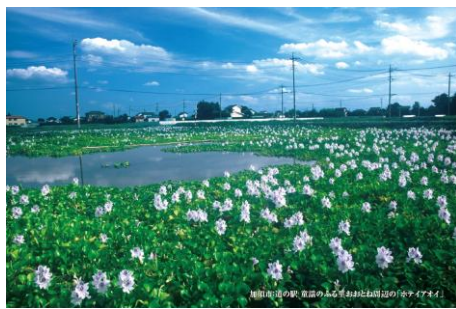
道の駅おおとね周辺の「ホテイアオイ」