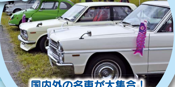
国内外の名車が大集合!